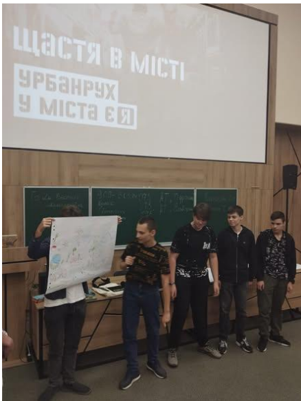
13.09.2024р. Міжнародний проект Урбан рух "У міста є Я" Сьогодні - "Щастя в місті!"

Протягом року проводились години спілкування, тематичні лекції, круглі столи, тренінги, спрямовані на формування правосвідомості, культури міжособистісного спілкування, здорового способу життя та попередження негативних явищ у студентському середовищі.